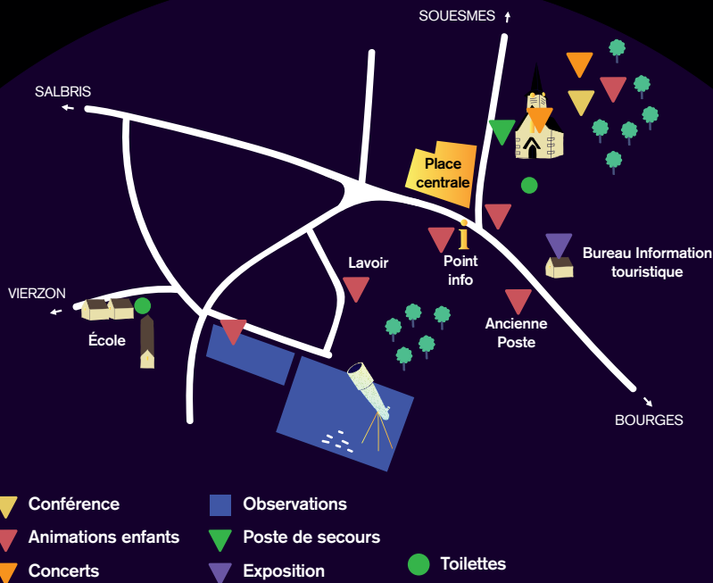
Illustration et design graphique : Garocaro (Caroline Ledys) - Ne pas jeter sur la voie publique.